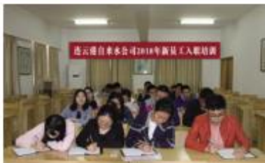
地参观学习,并结合培训期间学习内容对新入职员工进行理论和实操考核,考核结束后新员工将会在第三水

培训期间,人力资源部会同公司团委召开“以心迎新 携手前行”为主题的座谈会,各团支部书记及优秀员工代表参加座谈会并分享了他们在公司的成长历程。培训最后一天,组织新员工赴沐新泵站对水源地进行实地参观学习,并结合培训期间学习内容对新入职员工进行理论和实操考核,考核结束后新员工将会在第三水