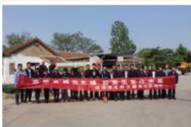
近日,公司党委开展了“高质发展当先锋,后发先至作表率”主题党日活动。